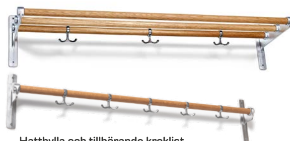
Hatthylla och tillhörande kroklist I ek och aluminium. Kroklisten är valbar om plats finns enligt ritning.

Som fritt val finns fyra olika kulörer på väggfärg.