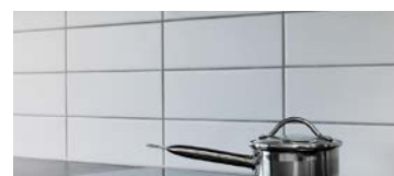
Stänkskydd Vitt, blankt. 300x100 mm. Rak plattsättning, ljusgrå fog.