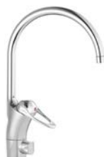
Köksblandare Engreppsblandare med diskmaskinsavstängning.