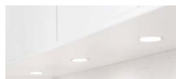
Bänkbelysning Infälld LED-belysning under överskåp.