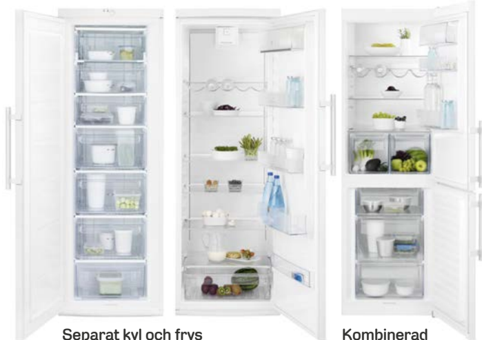
Separat kyl och frys Vit, energiklass A+.