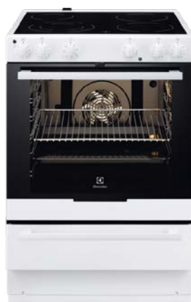
Spis Glaskeramikhäll med varmluftsugn, energiklass A.