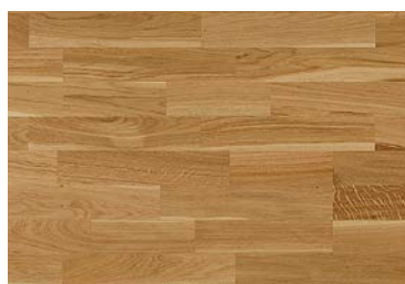
Golv Mattlackad ekparkett.

Lägenheten är genomgående målad i vitt. I vardagsrum, kök och sovrum läggs en mattlackad ekparkett och i hall grå klinker med grå fog.