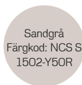
Sandgrå Färgkod: NCS S 1502-Y50R