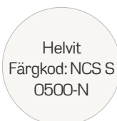
Helvit Färgkod: NCS S 0500-N

För att se rätt färgnyans, titta på en färgkarta i en måleributik eller i vår Fint Hemma-butik på Hornsgatan 128. På bildskärm eller utskrift kan nyansen avvika.