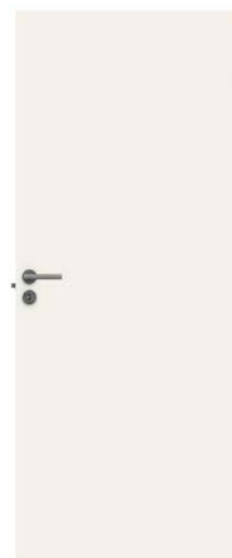
Innerrörrar Vita släta.

För att se rätt färgnyans, titta på en färgkarta i en måleributik eller i vår Fint Hemma-butik på Hornsgatan 128. På bildskärm eller utskrift kan nyansen avvika.