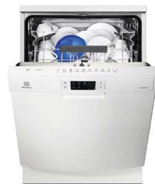
Diskmaskin Vit, energiklass A.