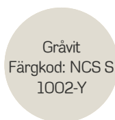
Gråvit Färgkod: NCS S 1002-Y