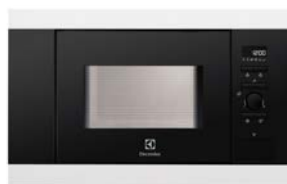
Mikrovågsugn Vit, 800W.