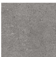
Golvklinker I hall monteras grå klinker med mörkgrå fog, 600x600 mm.