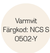
Varmvit Färgkod: NCS S 0502-Y

Som fritt val finns väggfärg i ytterligare fyra olika kulörer, som alla harmonierar med varandra, om du vill ha olika kulörer i olika rum. De är också valda för att passa ihop med inredningen i övrigt. I hallen kan du själv bestämma om du vill ha en hatthylla och kroklist i ek/aluminium monterad.