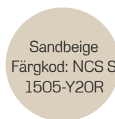
Sandbeige Färgkod: NCS S 1505-Y20R