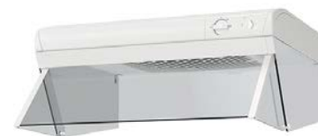
Fläkt Vit med spisvakt.