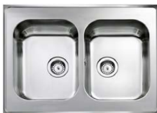
Diskho 80 cm bred rostfri diskho med två hoar.