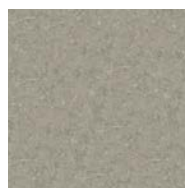
Fönsterbänk I natursten.