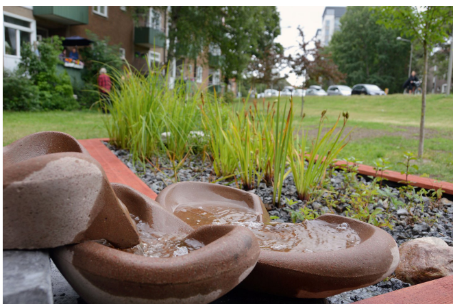
Vattentrappan och växtbädden i Gröna Solberga där vi testar nya sätt att ta tillvara på regnvatten.

Vi medverkar även i två projekt inom Vinnova, Sveriges innovationsmyndighet. Ett om hantering av dagvatten på kvartersmark, och ett om utvecklingen av gröna täta tak.