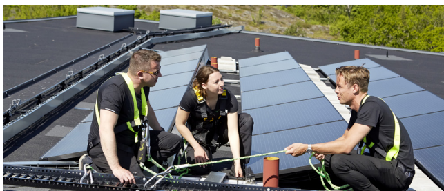
Under året invigde vi en stor solcellsanläggning på ett tak i Årstadal.

På Stockholmshem arbetar vi strategiskt för att öka vår produktion av förnyelsebar energi. Möjligheten att installera solceller ska alltid utvärderas när vi bygger nytt och bygger om. Under 2019 tog vi fram en strategi och plan för solcellsutbyggnad och ökade vår producerade solenergi med 30 procent. 2020 ökade den med ytterligare 80 procent. Vårt långsiktiga mål för solceller följer stadens miljöprogram – 5 550 kWp installerad effekt år 2040, vilket motsvarar 10 procent av vår elförsörjning.