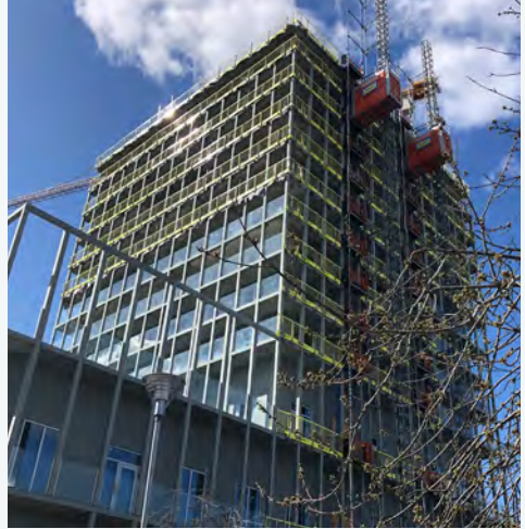
Huset får en milt grön färg med balkonger som löper runt hela huset och takterrass för de som bor och jobbar där. Och hägt hus = fantastisk utsikt!

Om du varit förbi Skärholmen, eller åkt på E4 förbi Kungens kurva på senaste tiden har du säkert sett att ett stort hus växer fram vid Skärholmen centrum. Det är vårt 23 våningar höga hus som beräknas stå klart 2024. Det byggs på Bredholmstorget, strax intill gallerian. I huset blir det hyresgäster i 102 lägenheter, Stockholmsheims nya kontor och plats för kulturverksamhet, så det som idag är en ganska tom plats fylls med liv. Huset växer med en våning i veckan, så snart är alla våningar på plats!