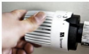
Stockholmshem håller normalt 20–21 grader i lägenheterna.

De allra flesta av Stockholmsheims lägenheter värms med element, så kallade vattenradiatorer. Det är det varma vattnet i elementen som värmer upp lägenheten. Vi tycker att det är viktigt att