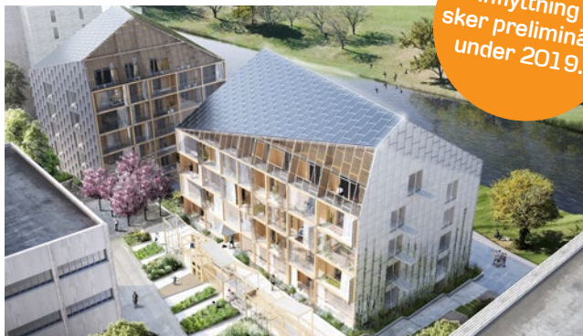
Illustration: Dnelli Johansson

I hård konkurrens utsågs Stockholmshem 2014 till vinnare i Stockholms stads prestigefyllda tävling om en markanvisning i Norra Djurgårdsstaden. Fokus ligger både på miljöriktigt byggande och boende och projektet vann tack vare ”ett helhetstänk för energieffektivitet och goda boendemiljöer med ett intressant och spännande arkitektoniskt uttryck”. Det blir ett spjutspetsprojekt med en kombination av tekniker som solceller, eget