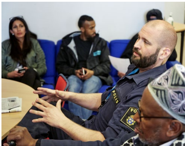
Tillsammans med polis och andra viktiga samhällsaktörer går gruppen igenom läget i stadsdelen innan det är dags att börja kvällens pass.

– Vi måste visa att vi finns, vilka vi är ska vara tydligt. Vi vill vara en naturlig del av