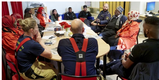
Räddningstjänsten bidrar med viktig information.

Ännu en kväll har gruppen bidragit till en trevligare stämning i Rinkeby, ännu en kväll har de visat barn och ungdomar att de finns. Kvällen går över i natt med fler trygga invånare i stadsdelen. ■