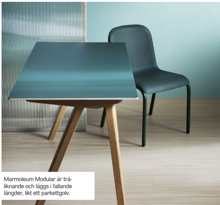
Marmoleum Modular är träliknande och läggs i fallande längder, likt ett parkettgolv.

Slitstarkt och Svanenmärkt Marmoleum Modular består till närmare 90 procent av