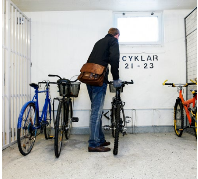
Tillsammans ser vi till att hålla våra hus brandsäkra och fria från lösa föremål.

Din och dina grannars säkerhet är viktig för oss men ett bra brandskydd bygger på att alla parter, både hyresvärd och hyresgäst, tar ansvar för det. För att säkerställa att vi på Stockholmshem gör vad vi kan kommer vi därför att aktivt arbeta för att hålla våra allmänna utrymmen fria från föremål. Vid en eventuell brand är det viktigt att du och dina grannar kan ta er ut från era lägenheter,