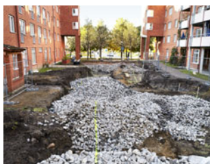
Upprustningen pågår under hösten.

Sedan september har Stockholmshem arbetat med att rusta upp stråket som går från bussarna på Horisontvägen in mot Skarpnäcks allé. 18 träd har fällts och