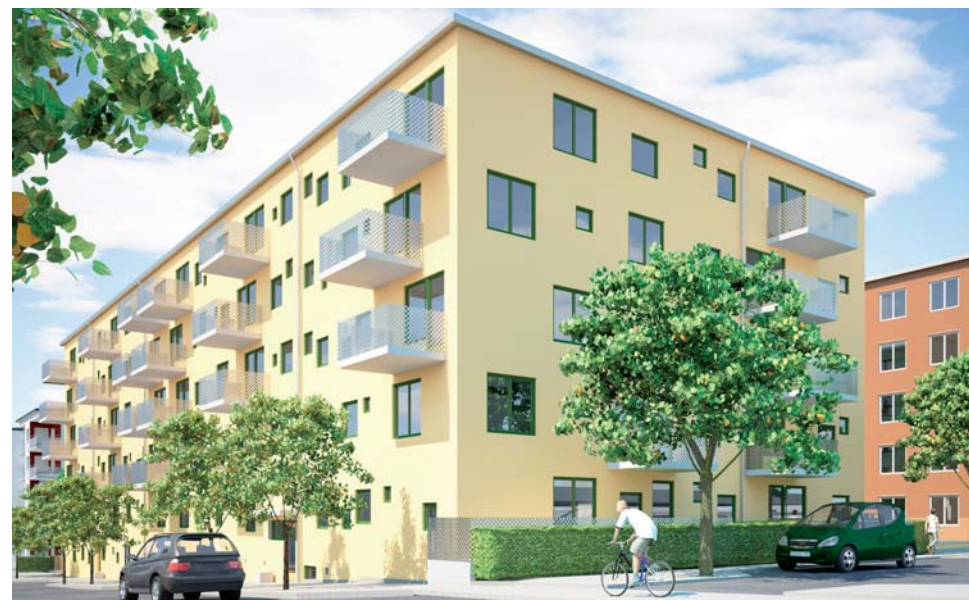
I Örnberg bygger Stockholmshem 140 lägenheter med bokningsstart i höst.

–Träd har ett ekologiskt värde i en stadsmiljö. Det är viktigt för trivselen med gröna gårdar som i sin tur ger möjlighet till samvaro för våra hyresgäster, säger han. □