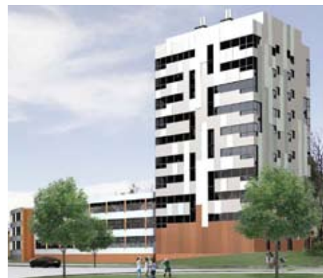
3D-grafik över Stockholmsshems samarbetsprojekt med jagvillhabostad.nu.

De kommande åren kommer tusentals unga att vilja flytta hemifrån i Stockholm. Varje år. Ett sätt att möta detta är att försöka bygga nya lägenheter med rimliga hyror direkt för unga.