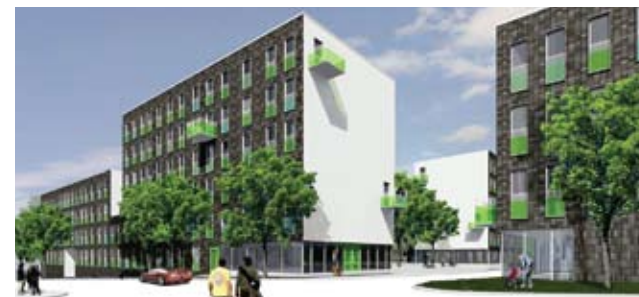
3D-grafik över arkitektens förslag på Stockholmsheims nyproduktion i Annedal.

Nu är det klart att det blir en bouställning i Västerort i det nya området Annedal i Mariehäll utmed en uppiffad Bällstaå – år 2012.