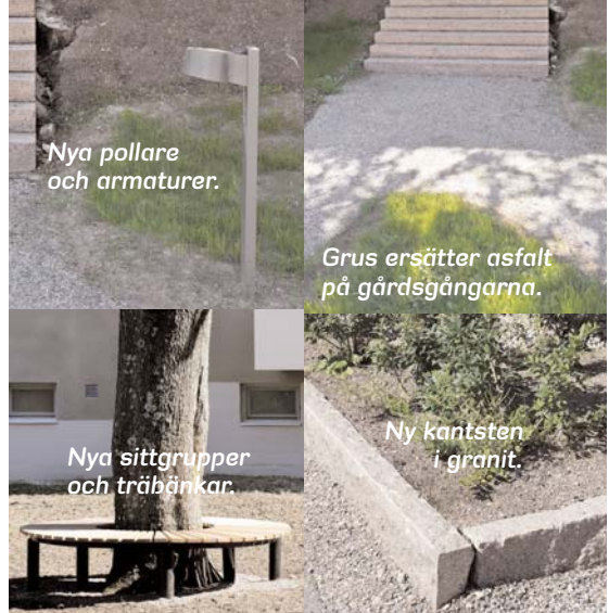
Nya pollare och armaturer.

Tillsammans med hyresgästerna, en arborist (trädvårdsspecialist) och landskapsarkitekter har Stockholmshem diskuterat kring vilka träd som skulle sparas och vilka