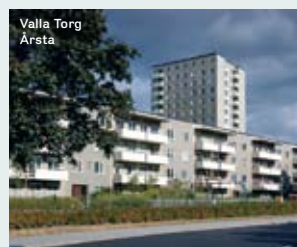
Valla Torg Årsta