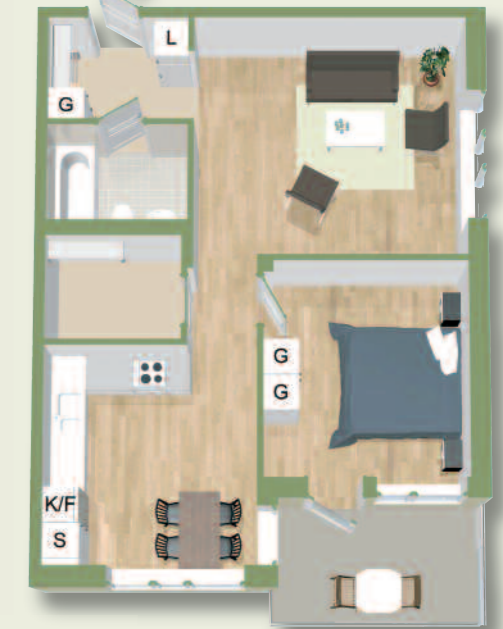
2 RoK 62 kvm