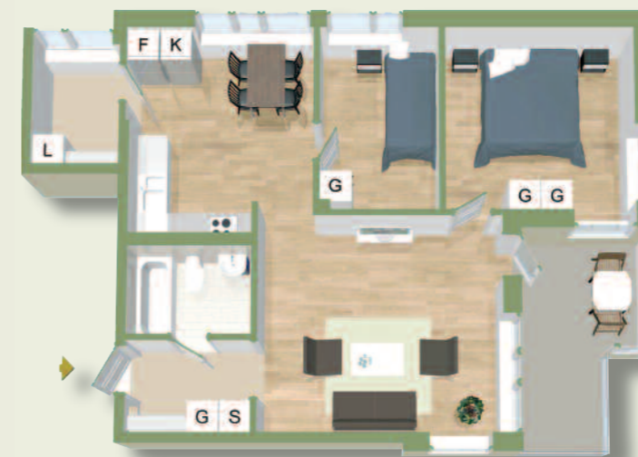
3 RoK 70 kvm