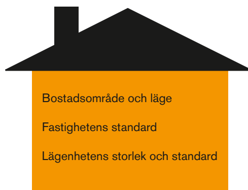
Figur 1. Bruksvärdeshyrans beståndsdelar

Stockholmsmodellen bygger i grunden på att bruksvärdet påverkas av lägenhetens storlek och standard, fastighetens standard och bostadsområdets karaktär och läge. Bruksvärdet är högre för en stor lägenhet jämfört med en liten lägenhet. En nybyggd och modern lägenhet har ett högre bruksvärde än en lägenhet med äldre standard. En lägenhet i ett mindre attraktivt område har ett lägre bruksvärde än en motsvarande lägenhet i ett mer attraktivt bostadsområde. Detta kan åskådliggöras i följande figur.