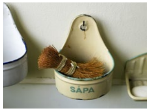
Ett riktigt kök och badrum upplevdes som lyx när familjerna flyttade in sina nya lägenheter.