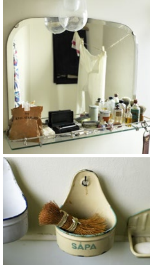
Ett riktigt kök och badrum upplevdes som lyx när familjerna flyttade in sina nya lägenheter.