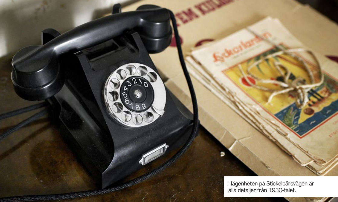
I lägenheten på Stickelbärsvägen är alla detaljer från 1930-talet.