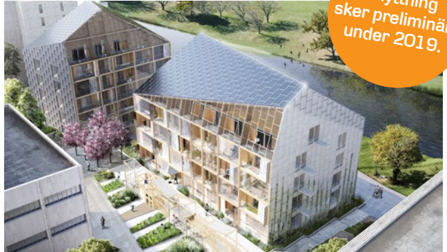
Illustration: Dnrell Johansson

I hård konkurrens utsågs Stockholmshem 2014 till vinnare i Stockholms stads prestigefyllda tävling om en markanvisning i Norra Djurgårdsstaden. Fokus ligger både på miljöriktigt byggande och boende och projektet vann tack vare ”ett helhetstänk för energieffektivitet och goda boendemiljöer med ett intressant och spännande arkitektoniskt uttryck”. Det blir ett spjutspetsprojekt med en kombination av tekniker som solceller, eget