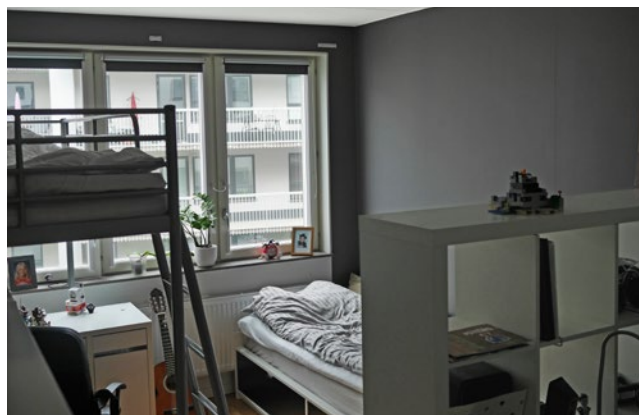
Före: mörka väggar, våningssäng och en hylla mitt i rummet.

Lösningen blev att behålla garderobsväggen och istället använda den som rumsavdelare. En elektriker kom och drog om elen så att båda