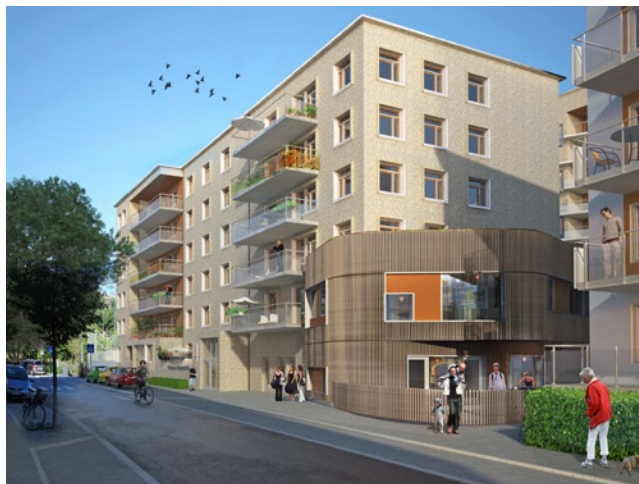
Illustration: AME arkitekter

Du hittar alla våra nybyggnadsprojekt på stockholmshem.se/Nyproduktion .