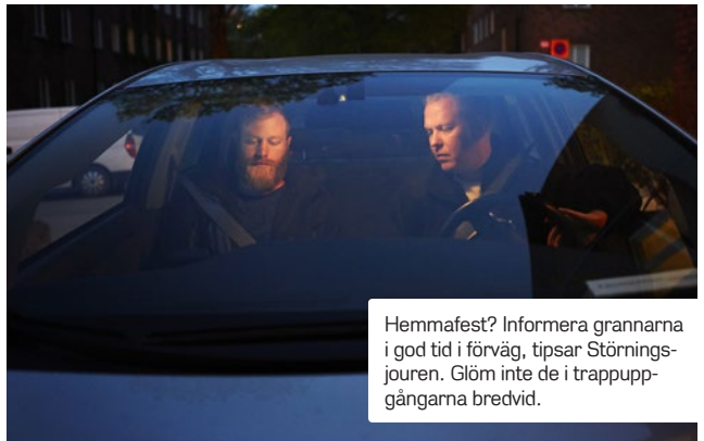
Hemmafest? Informera grannarna i god tid i förväg, tipsar Störningsjouren. Glöm inte de i trappuppgångarna bredvid.