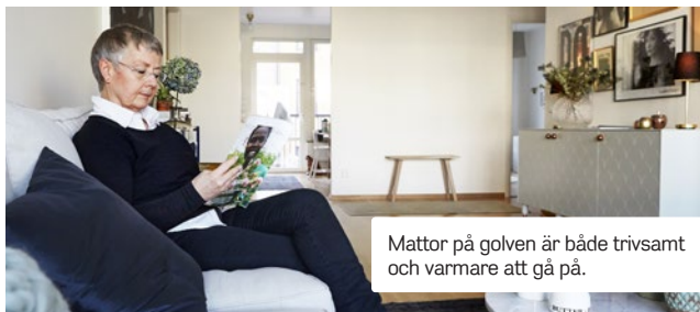
Mattor på golven är både trivsamt och varmare att gå på.

Då hindras värmen att komma ut i rummet.