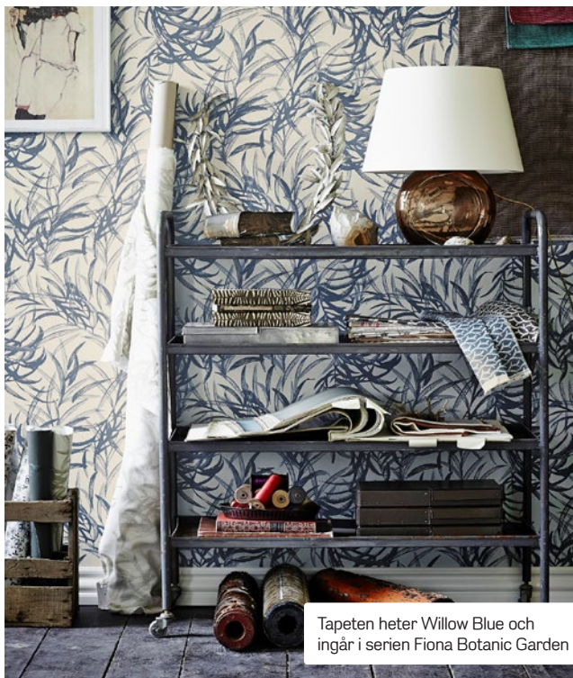
Tapeten heter Willow Blue och ingår i serien Fiona Botanic Garden

Inspirationen till de nya mönstren från Fiona Botanic Garden fick designern Helene Blanche under en promenad i Köpenhamns botaniska trädgård. De är handmålade med kol och akvarell. ■