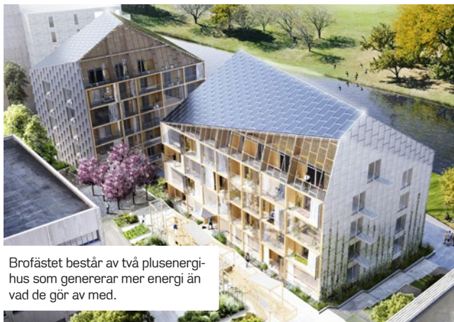
Illustration: Dinef Johansson

Plusenergihusen ska generera mer energi än vad de gör av med, sett till ett helt år. Det är framförallt under sommaren som huset producerar ett energiöverskott som täcker behovet under vintern. Energin som genereras i huset ska utgöras av närproducerad