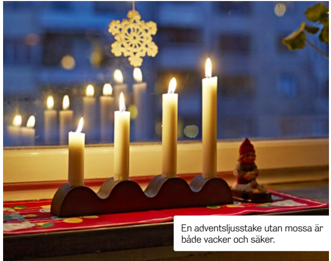
En adventsljusstake utan mossa är både vacker och säker.