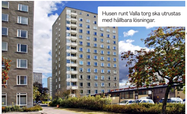
Husen runt Valla torg ska utrustas med hållbara lösningar.

De nya lägenheterna i Norra Djurgårdsstaden är ett led i ett långsiktigt arbete på Stockholmskem för att skapa hållbart boende. Förra året utsågs Stockholmskems passivhus i Hökarängen till Stockholms första Guldhushus av Sweden Green Building Council. ■