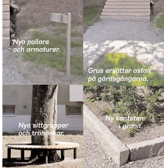
Nya pollare och armaturer.

Tillsammans med hyresgästerna, en arborist (trädvårdsspecialist) och landskapsarkitekter har Stockholmshem diskuterat kring vilka träd som skulle sparas och vilka