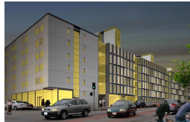
Vinnande förslaget i kategori Bevarande "Här bor jag". Burspråksliknande fönster med olika djup ger liv åt fasaden.

Vilket förslag det slutligen blir och när en byggstart kan ske är svårt att svara på idag men vår förhoppning är förstås att kunna börja bygga nya hyresrätter på tomten så snart som möjligt. □