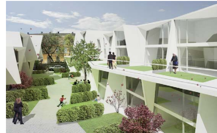
Vinnande förslaget i kategori Nybyggnad: "Z-raderna". Husen sicksackar sig fram och lämnar gröna passager genom kvarteret.

Förstapriset i den andra kategorin, Nybyggnad, som innebär ny bebyggelse på hela