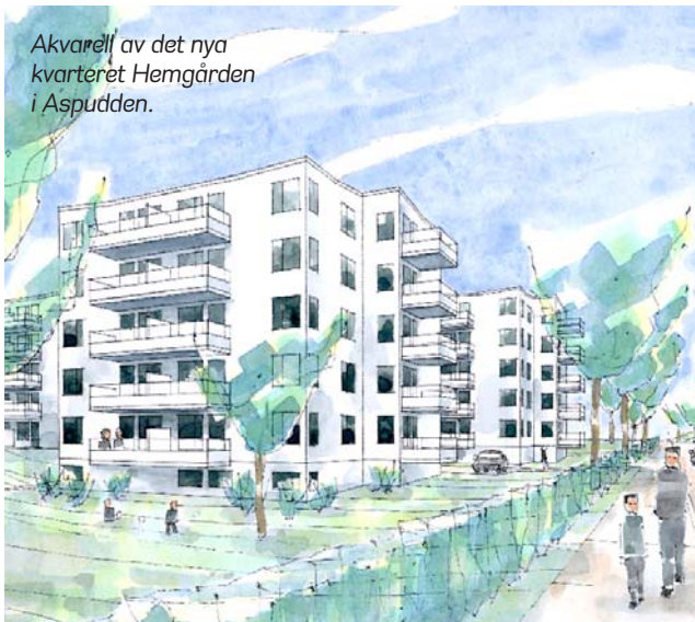
Akvarell av det nya kvarteret Hemgården i Aspudden.

Fem år. Så lång tid tar det ofta från att Stockholms-hem har mark att bygga på till det datum då första hyresgästen flyttar in i sin nya lägenhet. Att bygga nya Stockholms-hem är en lång process, bland annat måste grannarna få säga sitt.