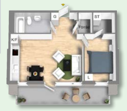
2 RoK, 55 kvm