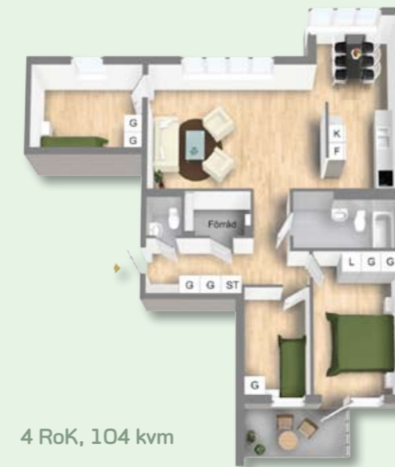
4 RoK, 104 kvm