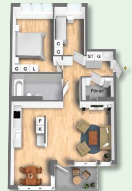
3 RoK, 82 kvm