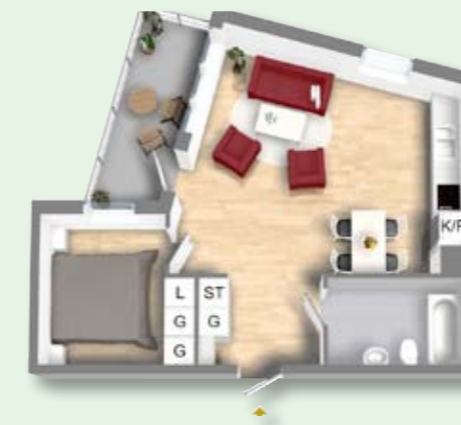
2 RoK, 50 kvm

Se alla lägenheter och ritningar i 3D-presentationen av kvarteret Sjövik på www.stockholmshem.se/nybygg .