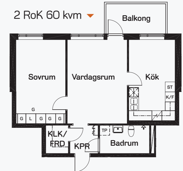
2 RoK 60 kvm ▼