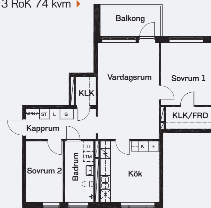
3 RoK 74 kvm ▶