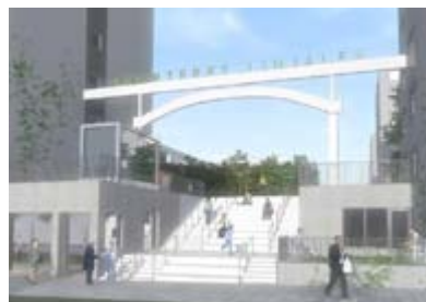
Trappan byggs om, blir mer ljus och öppen och tillgängligheten förbättras med en ny hiss. Så här skulle den nya trappan kunna se ut.