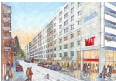
Så här kan entrén till livsmedelsbutiken se ut – entré i korsningen Magnus Ladulåsgatan och Swedenborgsgatan.